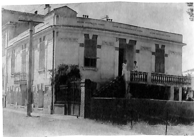
ΟΙΚΙΑ Ν. ΓΕΡΜΑΝΟΥ, ΣΤΗΝ ΟΔΟ ΠΑΠΑΚΥΡΙΑΖΗ ΣΤΗ ΘΕΣΣΑΛΟΝΙΚΗ

Στα 1925 βρισκόταν εκτός βουλής, διότι δεν συμμετείχε στις εκλογές του 1924, από την οποίαν απείχαν τα αντιβενιζελικά κόμματα. Τον Απρίλιο του έτους εκείνου, παρά τα σοβαρά πολιτικά και οικονομικά