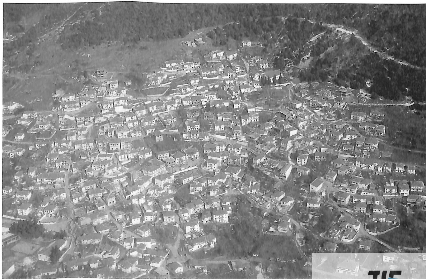
ΒΑΒΔΟΣ, ΑΕΡΟΦΩΤΟΓΡΑΦΙΑ 1993

Στην Αθήνα έγινε δεκτός ευνοϊκά, χωρίς όμως άμεσα αποτελέσματα, λόγω της κακής οικονομικής κατάστασης του Δημοσίου, μετά τον πόλεμο του 1897 και τον Διεθνή Οικονομικό Έλεγχο. Οι φίλοι του τον παρουσίασαν σε σημαίνοντα πολιτικά πρόσω-