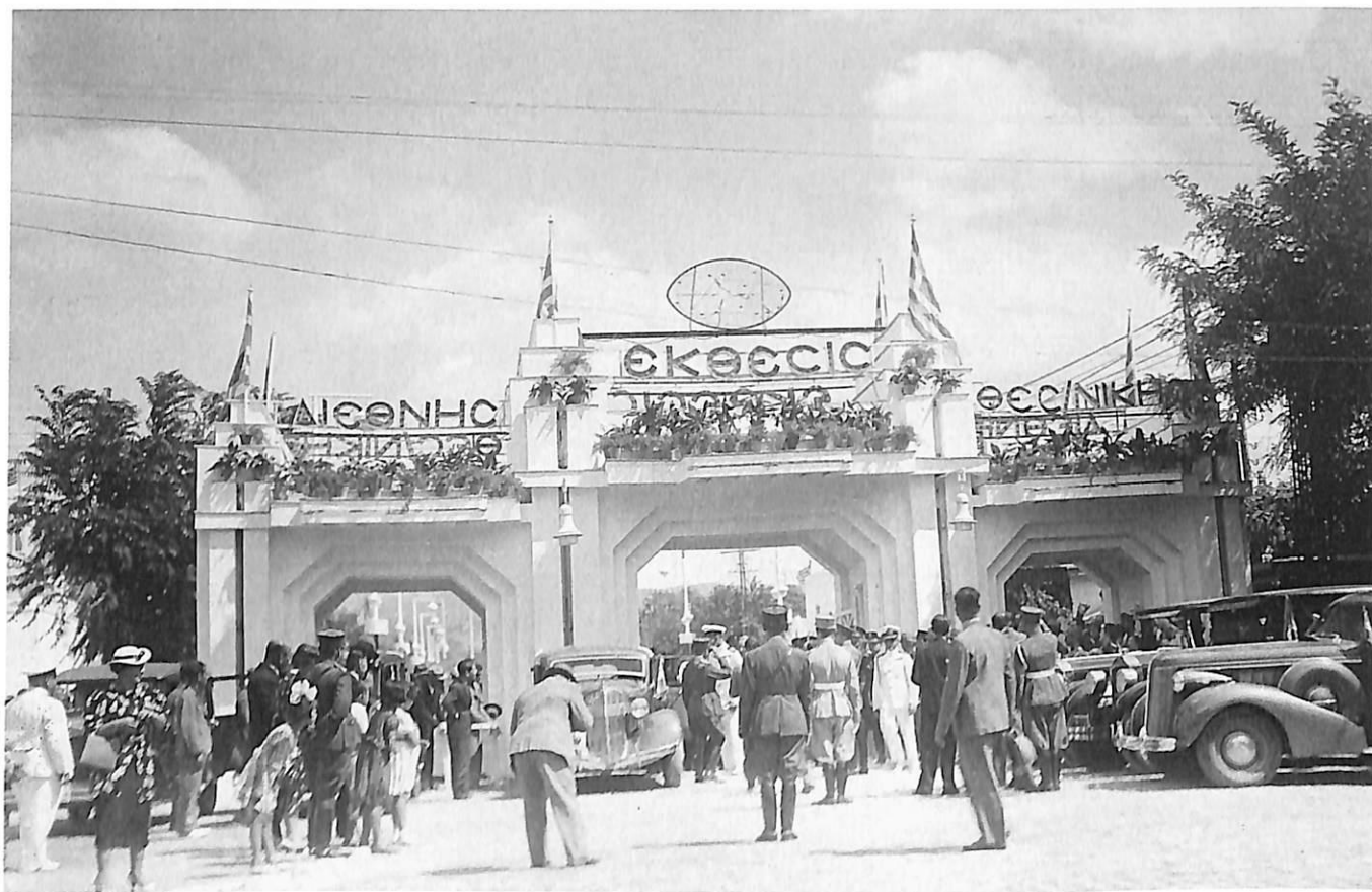
ΔΙΕΘΝΗΣ ΕΚΘΕΣΗ ΘΕΣΣΑΛΟΝΙΚΗΣ, 1926

εμπόδια, ο Ν. Γερμανός συνέλαβε την ιδέα για την ίδρυση μιας διεθνούς έκθεσης στη Θεσσαλονίκη και πρωτοστάτησε στην προσπάθεια για την ίδρυσή της. Το πιο σημαντικό κατόρθωμά του ήταν ότι συσπειρώσε όχι μόνο τους ομοϊδεάτες του, αλλά και τους τοπικούς παράγοντες των βενιζελικών κομμάτων και κατάφερε να τους πείσει να υποστηρίξουν την ιδέα του. Χάρη στην προσπάθειά του αυτή, οι διαδοχικές κυβερνήσεις της διετίας 1925-1926 ενέκριναν την πραγματοποίηση της έκθεσης και βρέθηκε χώρος για την εγκατάστασή της.