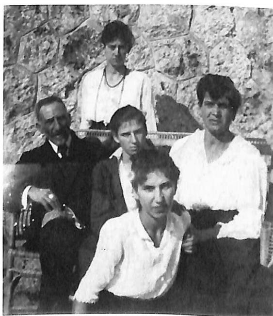
Ο Ν. ΓΕΡΜΑΝΟΣ ΜΕ ΤΗ ΣΥΖΥΓΟ ΚΑΙ ΤΙΣ ΤΡΕΙΣ ΚΟΡΕΣ ΤΟΥ: ΛΙΟΛΙΑ, ΑΛΕΞΑΝΔΡΑ ΚΑΙ ΜΑΡΙΑ ΧΡΗΣΤΙΔΟΥ

Ο Ν. Γερμανός άσκησε τα καθήκοντα του γενικού διευθυντή της Διεθνούς Εκθέσεως Θεσσαλονίκης μέχρι το θάνατό του, τον Ιανουάριο του 1935. Πέθανε στην προσπάθειά του να υπερνικήσει τα προσκόμματα της γραφειοκρατίας, με στόχο να αποκτήσει η ΔΕΘ οριστικές και ιδιόκτητες εγκαταστάσεις. Λίγο πριν πεθάνει, τηλεγράφησε στην οικογένειά του ότι ο σκοπός του είχε επιτευχθεί. Πράγματι, είχε θέσει τις βάσεις για να