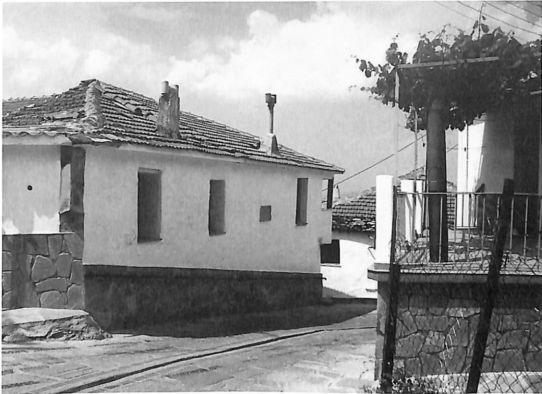
ΤΟ ΣΠΙΤΙ ΠΟΥ ΓΕΝΝΗΘΗΚΕ Ο ΝΙΚΟΛΑΟΣ ΓΕΡΜΑΝΟΣ ΣΤΗ ΒΑΒΔΟ

πα, όπως στον Ράλλη και στον Ζαΐμη, ενώ ο Ρέπουλης τον γνώρισε στον Βλάση Γαβριηλίδη, εκδότη της “Ακροπόλεως”. Ο Γαβριηλίδης του εξασφάλισε ένα εισιτήριο για την Αίγυπτο, όπου ο Ν. Γερμανός συνάντησε τον εθνικό ευεργέτη Αβέρωφ και υποστήριξε την ιδέα της δημιουργίας ενός επιστημονικού ενυδρείου. Ο Αβέρωφ, όμως, δεν έδειξε ενδιαφέρον. Πάλι με την βοήθεια των φίλων του, εξασφάλισε ένα εισιτήριο για την Οδησό και μία συνάντηση με τον εθνικό ευεργέτη Γρηγόριο Μαρασλή.