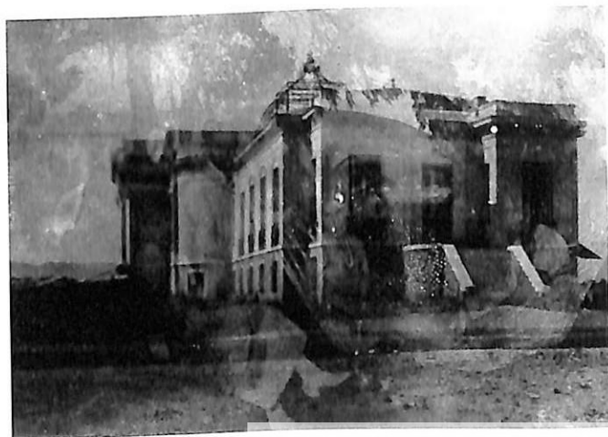
ΟΙΚΙΑ Ν. ΓΕΡΜΑΝΟΥ, ΣΤΟ ΖΩΟΛΟΓΙΚΟ ΚΗΠΟ ΤΩΝ ΑΘΗΝΩΝ